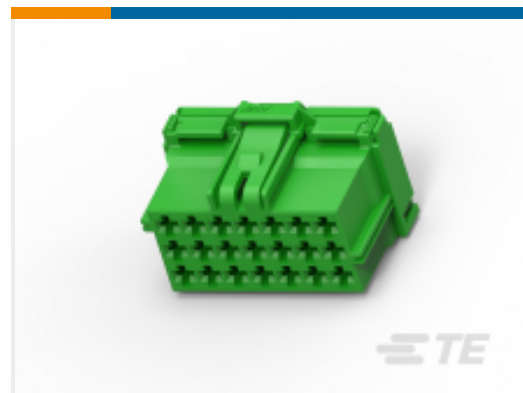
TE 产品编号1-2112891-2 AMP MCP, 非密封连接器壳体