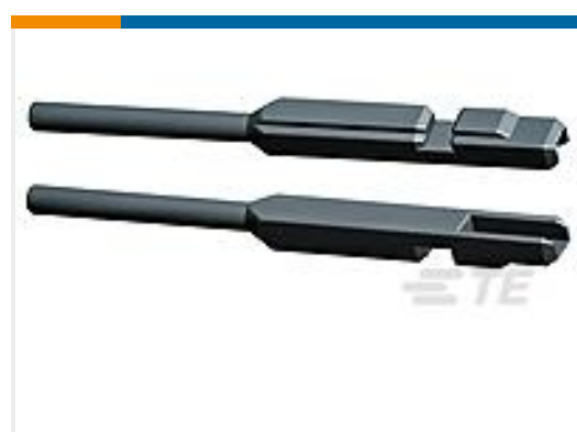
TE 产品编号1394871-1 MQS DICHTSTOPFEN