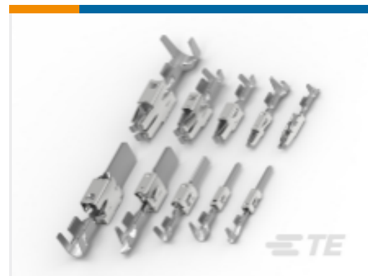
TE 产品编号962876-3 定时器, 母端和公端