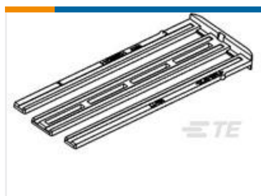
TE 产品编号1-1355134-1 RETAINER 94P