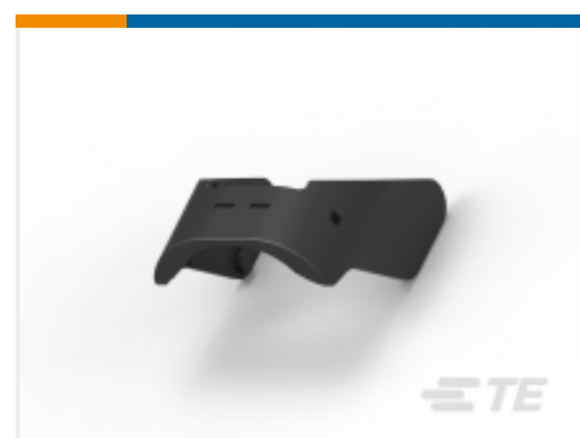
TE 产品编号1-1355133-1 HEBEL F.AUFNAHM-GEH