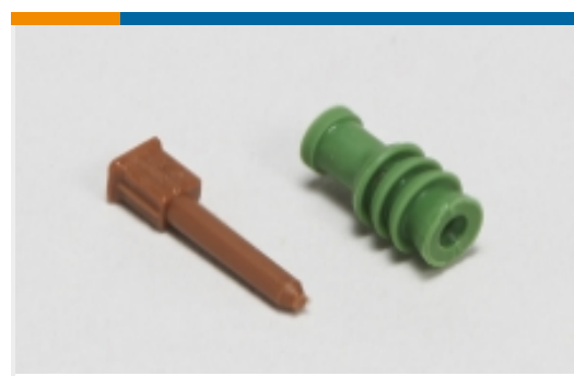
汽车密封件和盲堵(31)