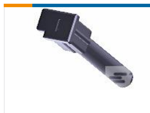
TE 产品编号1-1452424-1 BLIND PLUG FOR MCON 1.2 CB (0)