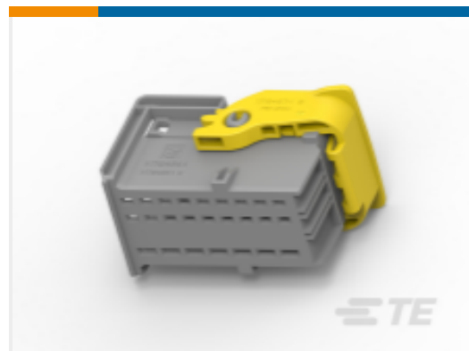
TE 产品编号1-1718484-4 AMP MCP 后盖