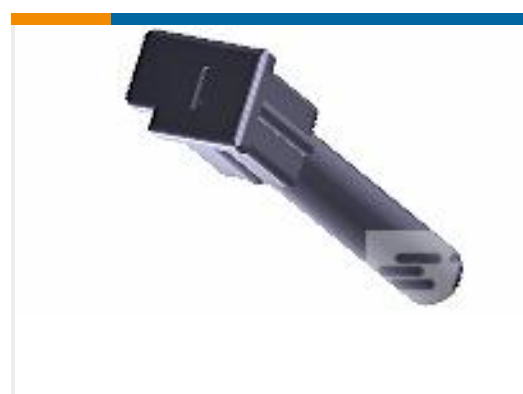
TE 产品编号1-1452424-2 BLIND PLUG FOR MCON 1.2 CB (1)