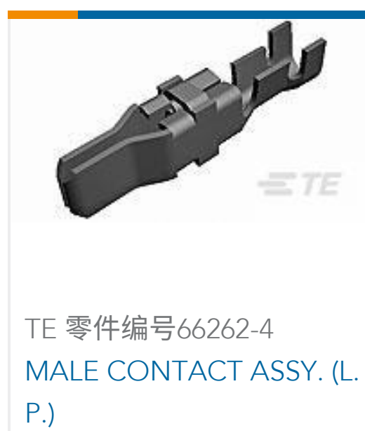
TE 零件编号 66262-4 MALE CONTACT ASSY. (L. P.)