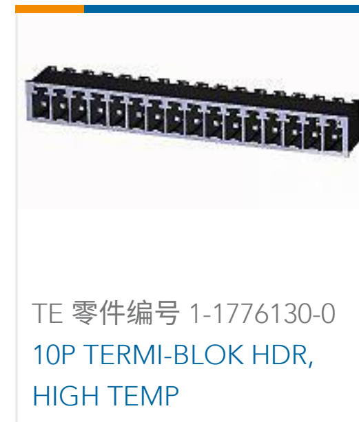
TE 零件编号 1-1776130-0 10P TERMI-BLOK HDR, HIGH TEMP