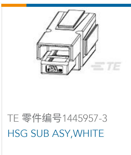
TE 零件编号 1445957-3 HSG SUB ASY, WHITE