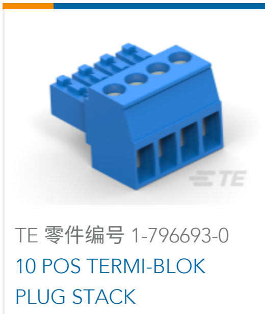
TE 零件编号 1-796693-0 10 POS TERMI-BLOK PLUG STACK