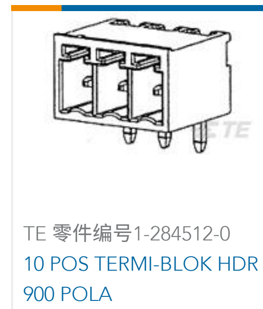
TE 零件编号 1-284512-0 10 POS TERMI-BLOK HDR 900 POLA