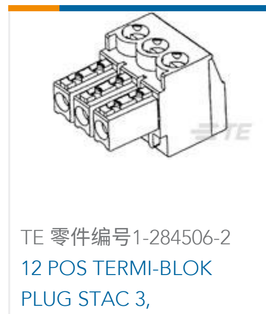
TE 零件编号 1-284506-2 12 POS TERMI-BLOK PLUG STAC 3,