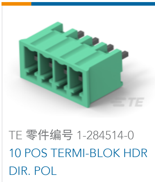
TE 零件编号 1-284514-0 10 POS TERMI-BLOK HDR DIR. POL