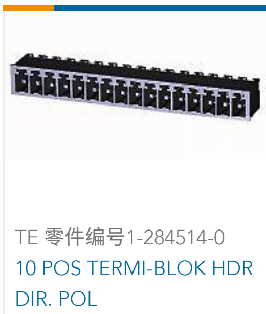
TE 零件编号 1-284514-0 10 POS TERMI-BLOK HDR DIR. POL