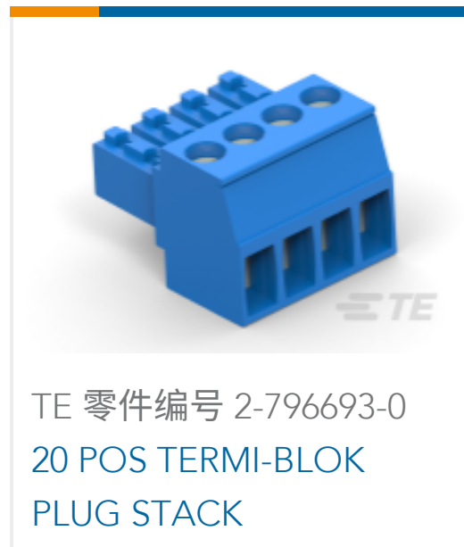
TE 零件编号 2-796693-0 20 POS TERMI-BLOK PLUG STACK