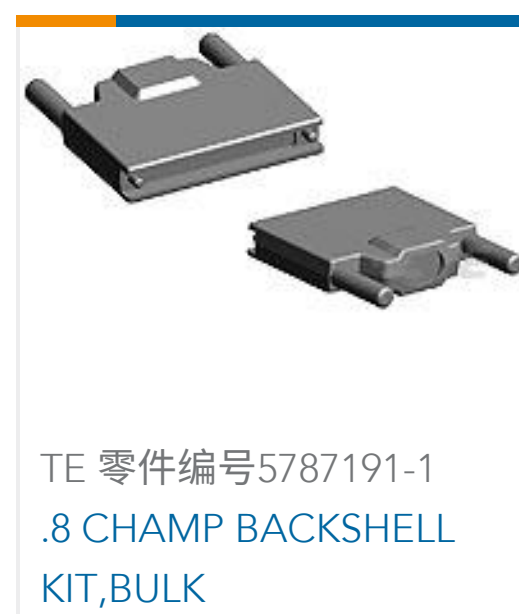
TE 零件编号 5787191-1 .8 CHAMP BACKSHELL KIT, BULK