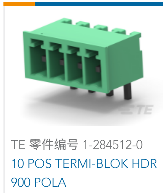
TE 零件编号 1-284512-0 10 POS TERMI-BLOK HDR 900 POLA