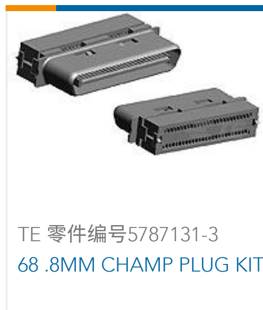
TE 零件编号 5787131-3 68 .8MM CHAMP PLUG KIT