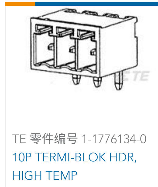
TE 零件编号 1-1776134-0 10P TERMI-BLOK HDR, HIGH TEMP