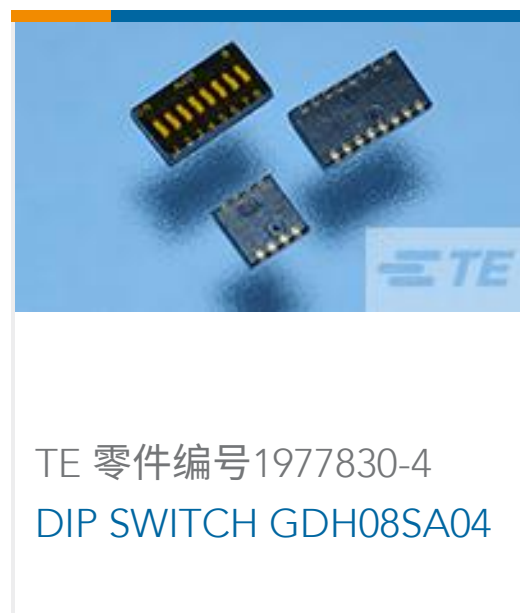
TE 零件编号1977830-4 DIP SWITCH GDH08SA04