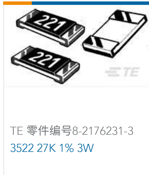
TE 零件编号8-2176231-3 3522 27K 1% 3W