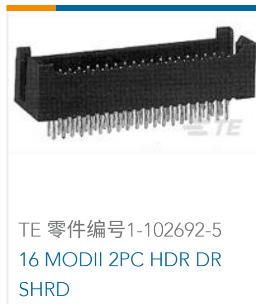
TE 零件编号1-102692-5 16 MODII 2PC HDR DR SHRD