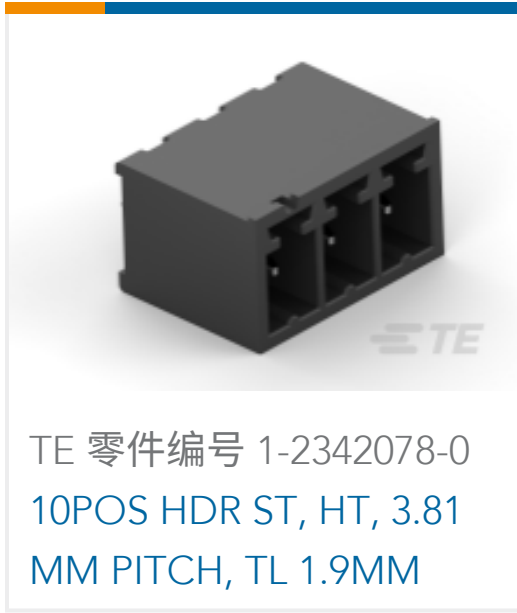
TE 零件编号 1-2342078-0 10POS HDR ST, HT, 3.81 MM PITCH, TL 1.9MM