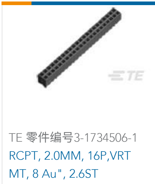
TE 零件编号3-1734506-1 RCPT, 2.0MM, 16P,VRT MT, 8 Au", 2.6ST