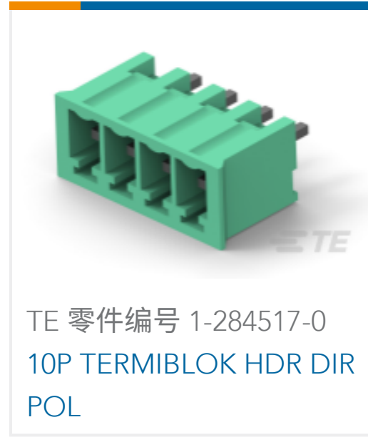
TE 零件编号 1-284517-0 10P TERMIBLOK HDR DIR POL