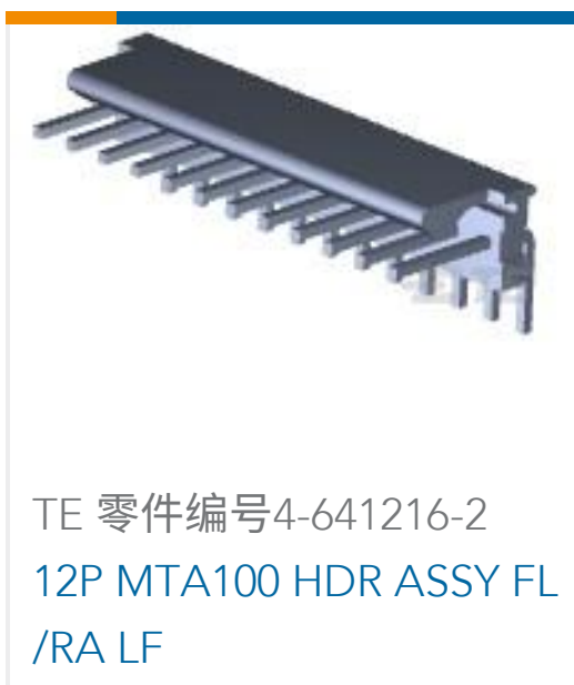
TE 零件编号4-641216-2 12P MTA100 HDR ASSY FL /RA LF