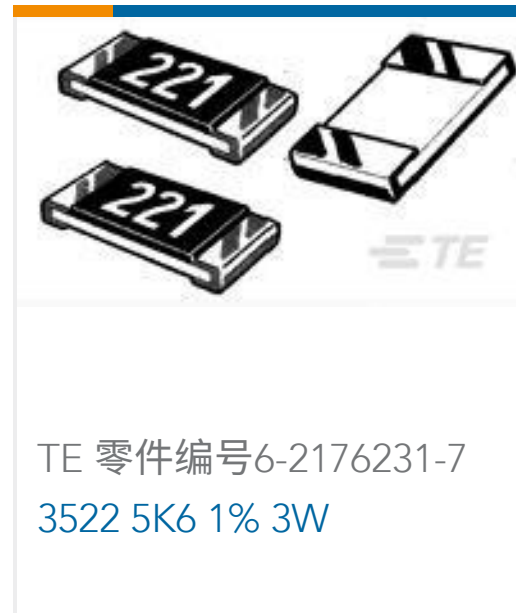
TE 零件编号6-2176231-7 3522 5K6 1% 3W