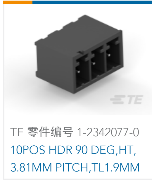
TE 零件编号 1-2342077-0 10POS HDR 90 DEG,HT, 3.81MM PITCH,TL1.9MM