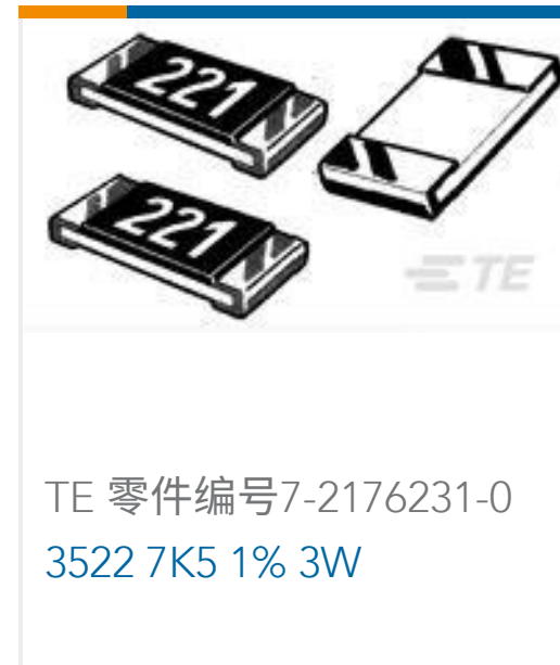
TE 零件编号7-2176231-0 3522 7K5 1% 3W