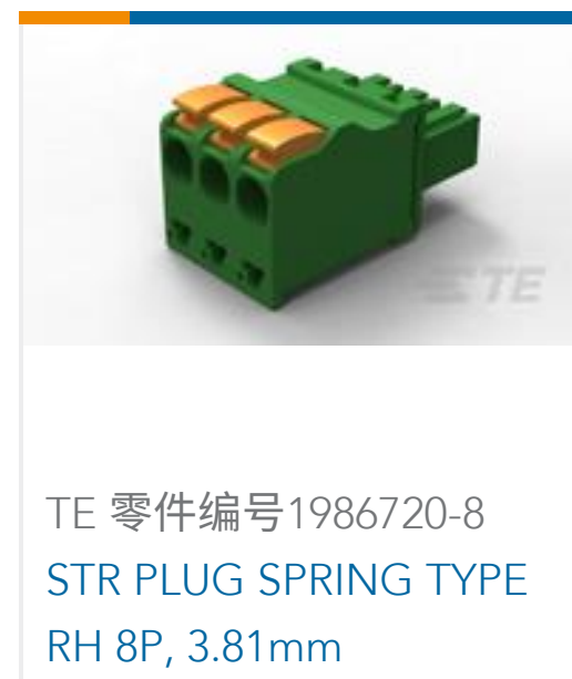
TE 零件编号1986720-8 STR PLUG SPRING TYPE RH 8P, 3.81mm