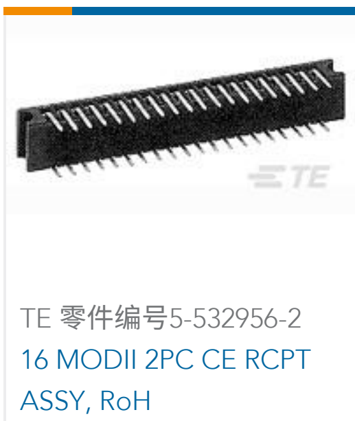
TE 零件编号5-532956-2 16 MODII 2PC CE RCPT ASSY, RoH