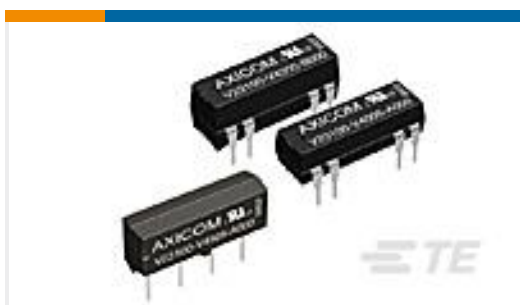
TE 零件编号1393763-4 V23100V4005A10