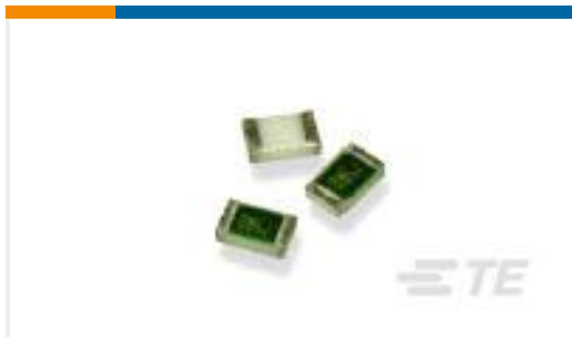
TE 零件编号7-1879224-2 CPF 0603 19K1 0.1% 25PPM 1K RL