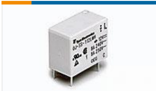
TE 零件编号1461492-5 OJT-SS-112LM,000 RELAY