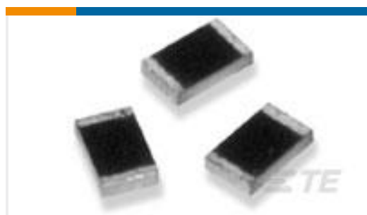
TE 零件编号4-1879258-6 RP 2B 787R 0.1% 15PPM CUT LENGTH