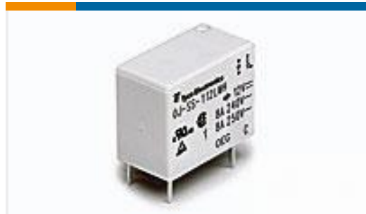
TE 零件编号1461492-2 OJT-SS-105LM,000