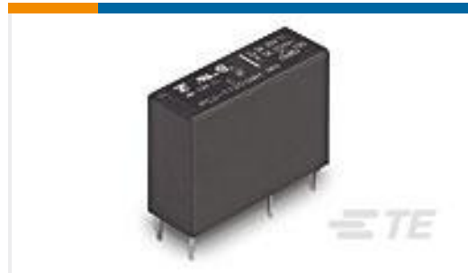
TE 零件编号1721531-4 PCJ-105D3MH,303